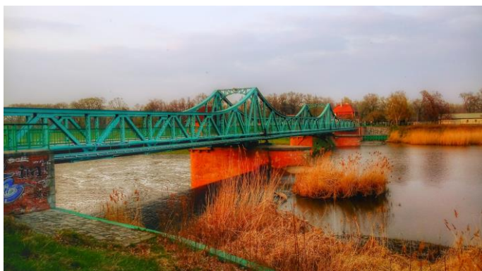
Błażej Bialik, G19, Wrocław