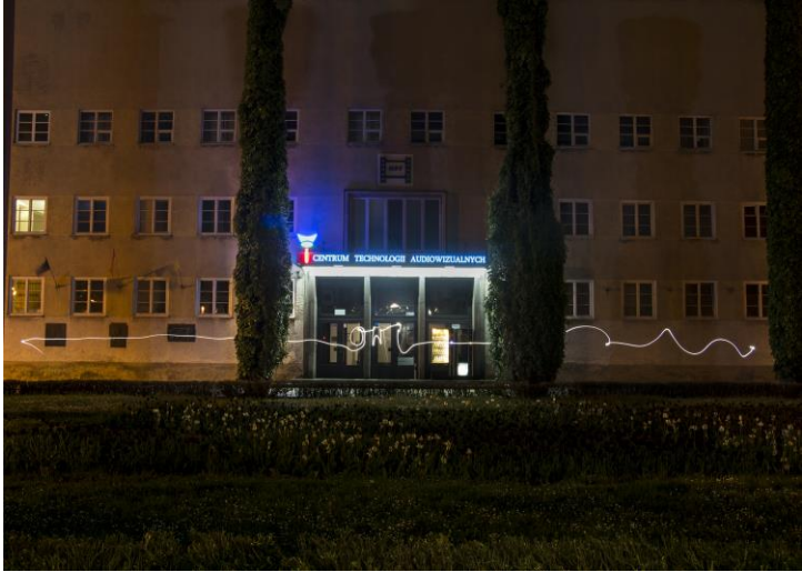
Mateusz Owsiany, T15, Wrocław