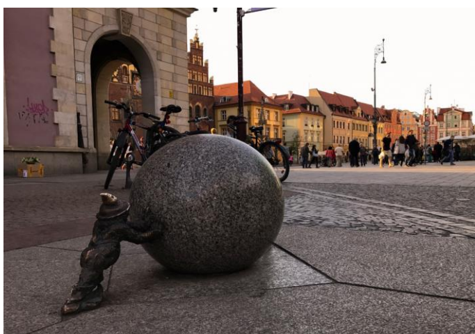
Natalia Zalewska, G 5, Wrocław